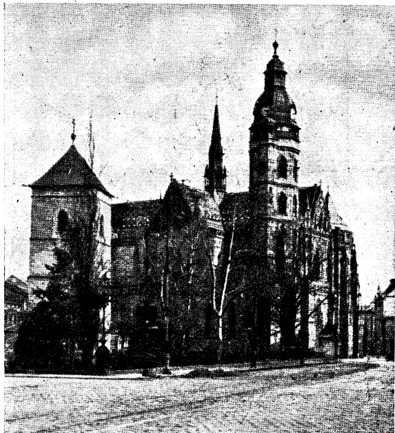
Árpád-házi Szt. Erzsébet világ-hírű templomában pihennek II. Rákóczy Ferenc hamvai.

Schmidt Antal atya. Jámbor, buzgó és alázatos lélek. A gyermekeket nagyon szerette. 21 éven át volt buzgó hitoktatójuk a buda-