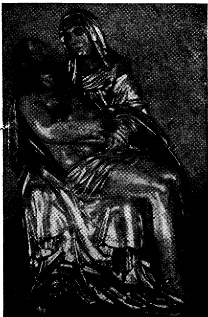
A Gyöngyösi Fájdalmas Szűzanya kegyszobra.