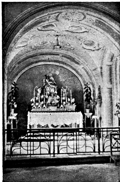
A Gyöngyösi Fájdalmas Szűzanya kegyoltára.