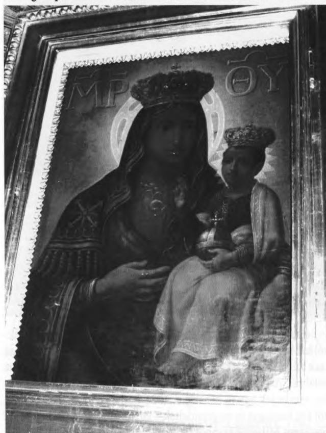
A kápolna kegyképe