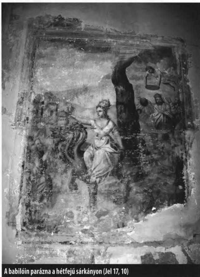
A babilói parázna a hétfejű sárkányon (Jel 17, 10)

mivel mégsem készültek belőlük ágyuk, a ferencesek visszakapták a harangjaikat Aradról. 30