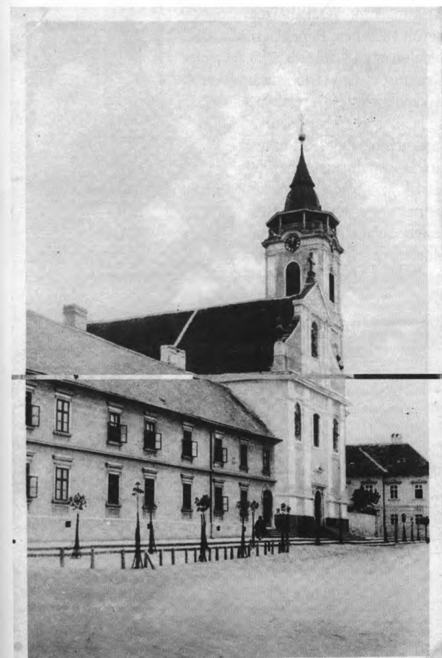
Baja Szent Ferenc-rendi templom

1848. december 30-i közgyűlésén a főbíró javaslatára Baja felajánlotta harangjainak egy részét a magyar kormánynak, valamint felkérte a ferenceseket és az ortodoxokat is, hogy csatlakozzanak ehhez a felajánláshoz. 29 1849. január 5-én a Barátok templomának tornyából is levettek egy (769 lat súlyú) harangot és nyolc más haranggal együtt Debrecenbe szállították, abból a célból, hogy ágyúkat öntsenek belőlük. A szabadságharc után,