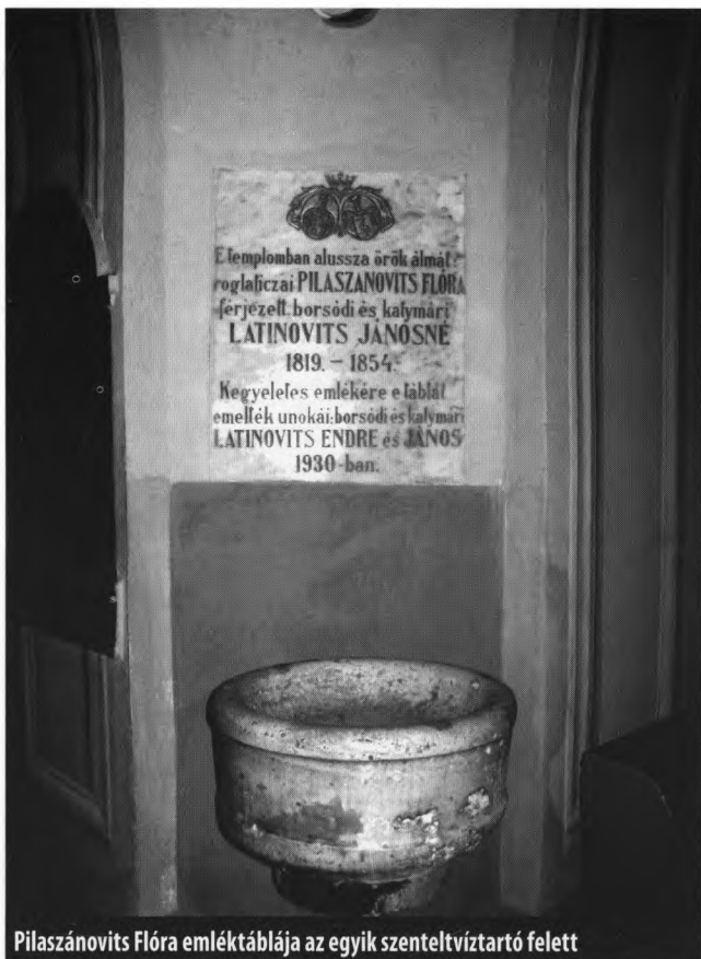
Pilaszanovits Flóra emléktáblája az egyik szenteltvíztartó felett