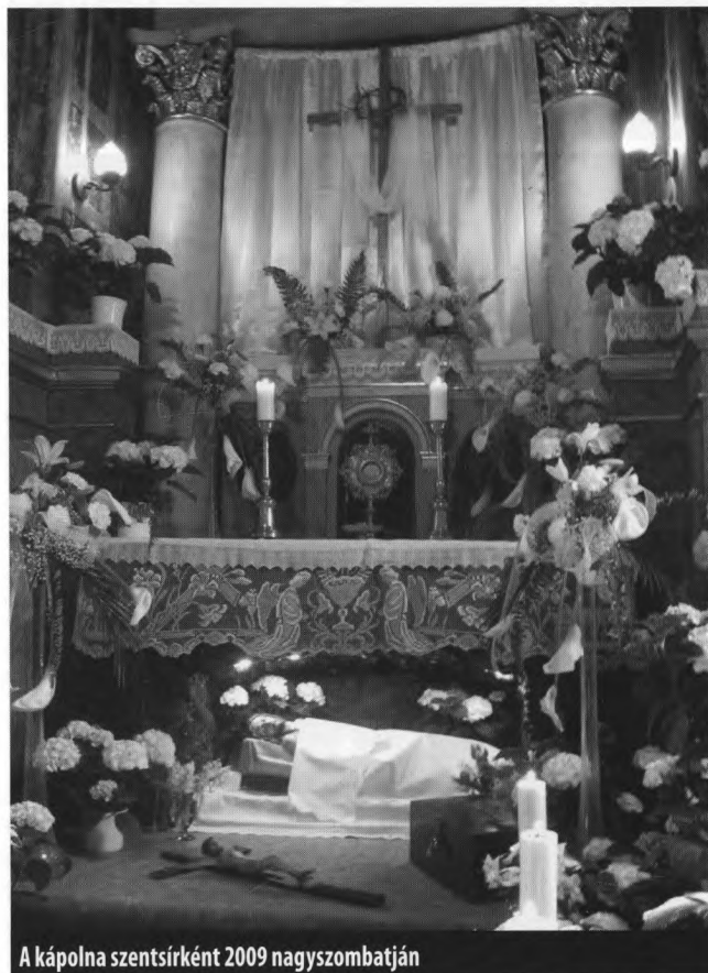
A kápolna szentsírként 2009 nagyszombatján

A kápolnára vonatkozó első írásos dokumentum a barátok Historia Domusa szerint a „Boldogságos Szűz Mária lorettói kápolnája” volt. Első említése 1775-ből származik, amikor az érsek „a torony alatti Szűz Mária-kápolnában néhány világinak adta föl a bérmlás szentségét.” 43 A 19. század elején is a legtöbbször mint „a kápolnai Boldogságos Szűz Mária oltárát” említik abból az alkalomból, hogy valamilyen fogadalmi ajándékot (offert) helyeztek el itt. 44