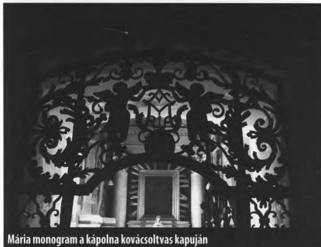
Mária monogram a kápolna kovácsoltvas kapuján