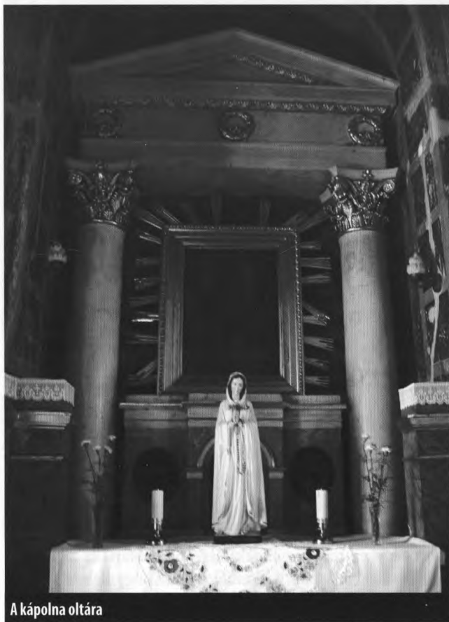
A kápolna oltára