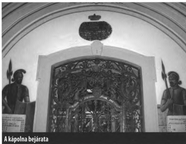
A kápolna bejárata

Az 1890-es években a tűzoltók közül hárman állandóan a „tűztoronyban” teljesítettek szolgálatot. Egyikük a toronyszobában volt a telefon mellett, egy pihent és egy az erkélyen figyelt, akit kétóránként váltottak fel. Nyolcnaponként kaptak egy szabadnapot, de ha ezen a napon