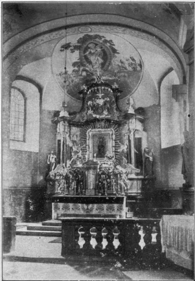
A szentkúti kegytemplom főoltára.