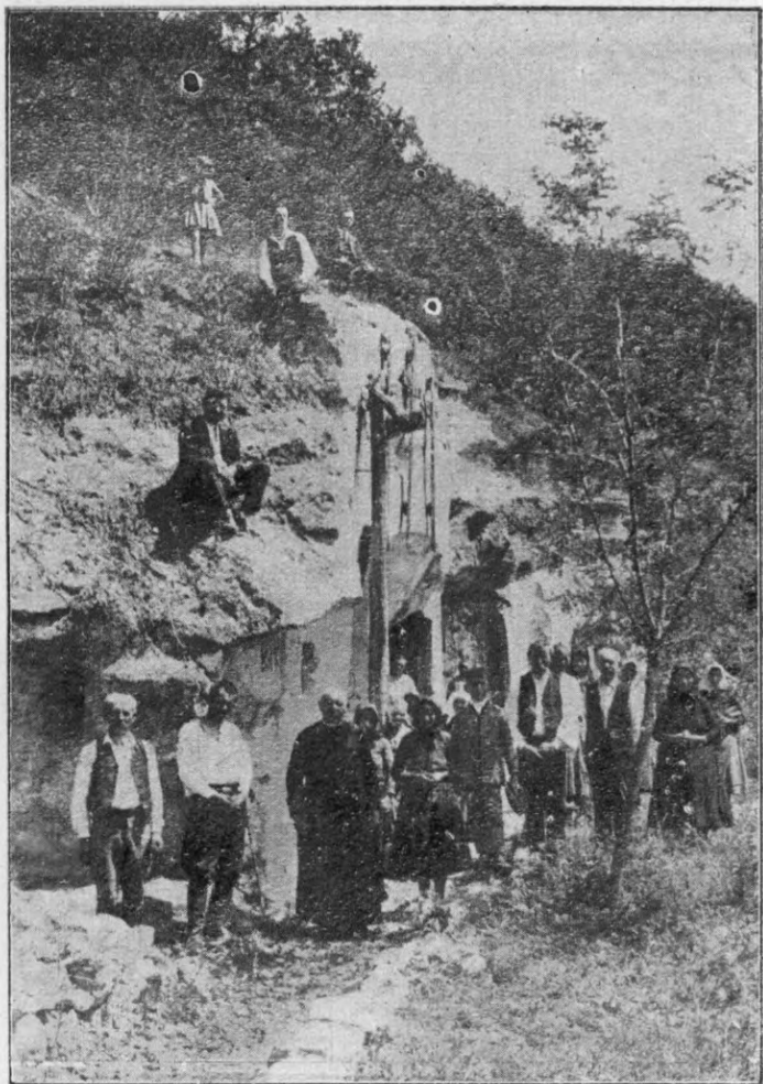
A szentkúti kegyhely remetebarlangja.