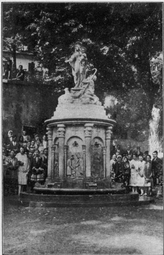
A sok csodától ékeskedő szent kút.