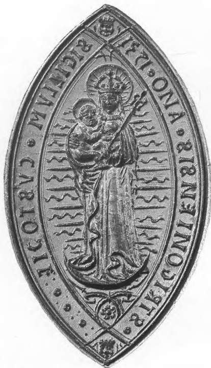
Az esztergomi custodia pecsétje, 1531