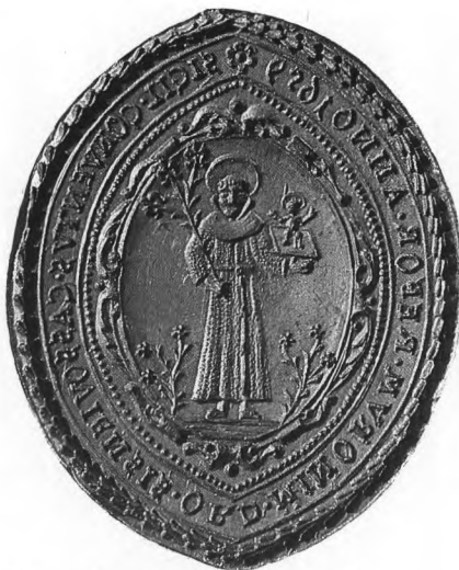
A kassai ferences konvent pecsétje, 1659

A pecsétlenyomatokról aránylag sokat tudunk, a pecsétnyomókról (typariumokról) viszont alig valamit. Aranyból, ezüsből, többnyire pedig bronzból készültek. Néhány milliméter vastag kerek vagy — egyházi pecséteknél — alul-felül csúcsos, ún. „mandorla” alakú lemezükbe mélyedő körirattal és ábrával látták el őket. Fogantyújuk a pecsételés technikájával együtt változott az idők folyamán. Bizonyos, hogy ötvösök vésték őket. Az egész középkorban használták továbbá az antik vésett köveket (gemmaikat), többnyire szintén ötvösmunkájú foglalatban, gyűrűben. A gemmapecsétek nálunk is megtalálhatók a XIII. századtól kezdve. A typariumokat rendszerint használatuk megszűntekor összetörték vagy rovátkolással elpusztították a felületüket, hogy elkerüljék az esetleges visszaéléseket. Magukról a pecsétvéső ötvösökről a korai időből nem maradtak írott adataink, vésnököket csak az újkorban tudunk azonosítani.