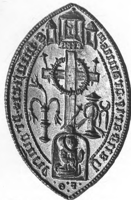
A salvatorianus rendtartomány pecsétje, a hozzá tartozó XVIII. századi leírás szerint 1517-től használták

A XII. században jelent meg nálunk a függő viaszpecsét. Felerősítésére bőrszalagot vagy sodrott selyem- illetve kenderzsinórt használtak. Eleinte az oklevél közepén fűzték át, onnan azonban a sú-