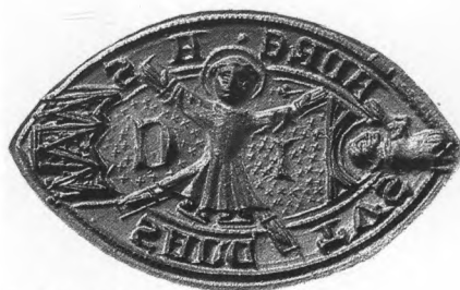
Egyházi méltóságviselő pecsétje, XIII. század

gyenek. Ezeket a szalagvégeket a viaszba nyomva azt a hártvához szorították. Ha le is vált az ilyen pecsét, a szalagok még sokáig az oklevélben tartották.